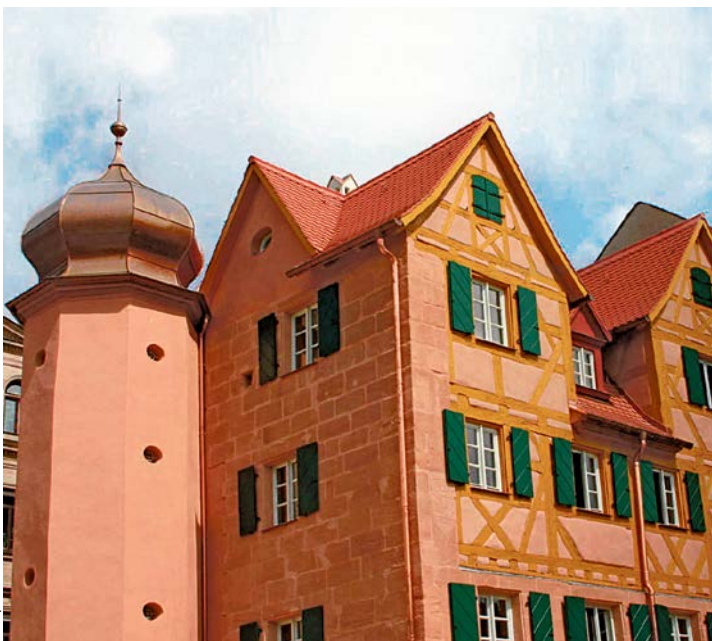
Das Lochnerische Gartenhaus, das älteste Gebäude der westlichen Innenstadt, wurde dank der Städtebauförderung generalsaniert und erstrahlt in neuem Glanz.