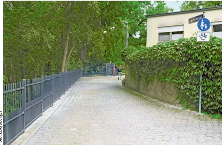
Ein dekorativer Metallzaun, eine neue Pflasterung und dazu eine neu errichtete Stützwand an der Böschungsseite: Die Engelhardtstraße wurde saniert und bildet nun das schicke Eingangstor zum Stadtpark.